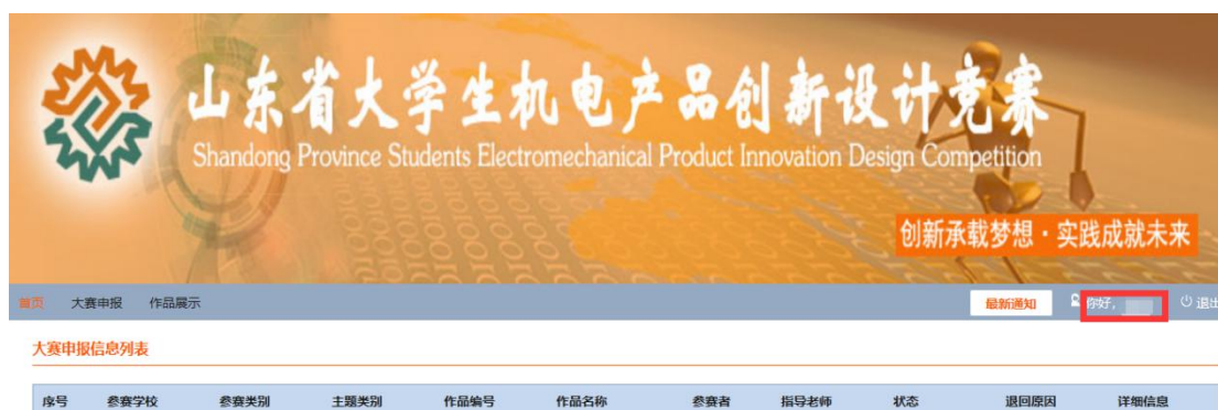
图 1 报名系统界面首页

学生的系统登陆账号由各单位大赛负责人发放，学生登录报名系统网址： http://123.60.221.43 ，通过该帐号登录系统（登录初始密码为123456），进入系统界面。如图 1 所示。